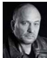
Falk Struckmann (Rocco)

ist seit 2006/07 Ensemblemitglied der Oper Stuttgart, wo sie 2016 zur Kammersängerin ernannt wurde. Zu ihren jüngsten Auftritten zählen u. a. die Titelpartie in Maria Stuarda , Chrysothemis in Elektra , Donna Anna ( Don Giovanni ) in Stuttgart. Weitere Engagements erfolgten u. a. an der Semperoper Dresden als Rosalinde in Die Fledermaus und als Hanna Glawari in Die lustige Witwe . In der Saison 2017/18 singt die vielbeschäftigte Sopranistin Salome u. a. an der Semperoper, Sieglinde ( Walküre ) an der Staatsoper Wien, Leonore ( Fidelio ) an der Mailänder Scala und an der Oper Stuttgart die Titelpartie von Medea .