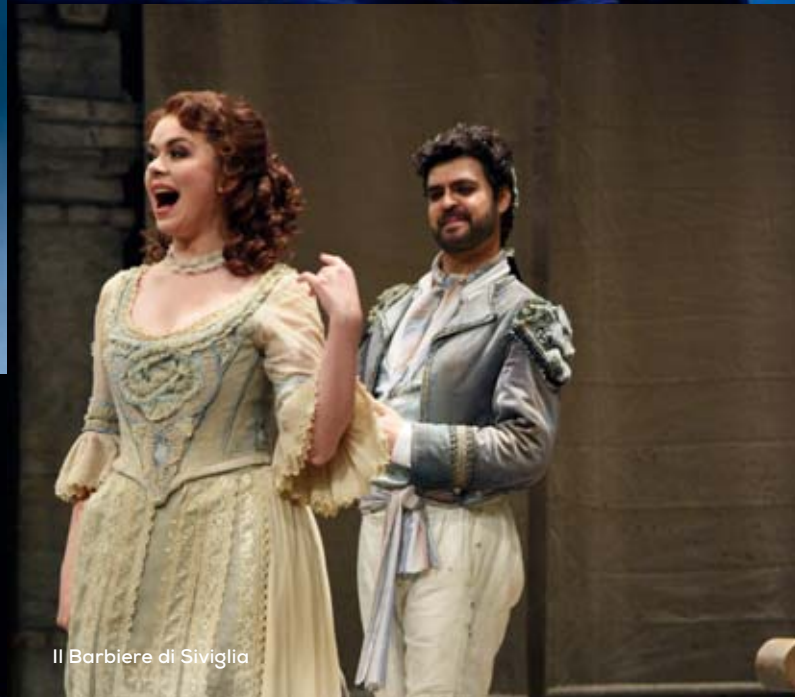
Il Barbiere di Siviglia