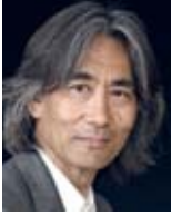
Kent Nagano (Musikalische Leitung)

gilt weltweit als einer der herausragenden Opern- und Konzertdirigenten. Er war Musikdirektor des Berkeley Symphony Orchestra, der Opéra National de Lyon, des Hallé Orchestra und der Los Angeles Opera sowie künstlerischer Leiter und Chefdirigent des Deutschen Symphonieorchesters Berlin. Von 2006 bis 2013 war er Generalmusikdirektor der Bayerischen Staatsoper. Seit 2006 ist Kent Nagano zudem Musikdirektor des Orchestre Symphonique de Montréal, seit 2013 auch Erster Gastdirigent der Göteborger Symphoniker. Er gastiert regelmäßig in allen wichtigen Musikmetropolen. Seit 2015/16 hat der aus Kalifornien stammende Dirigent das Amt des Hamburgischen Generalmusikdirektors inne.